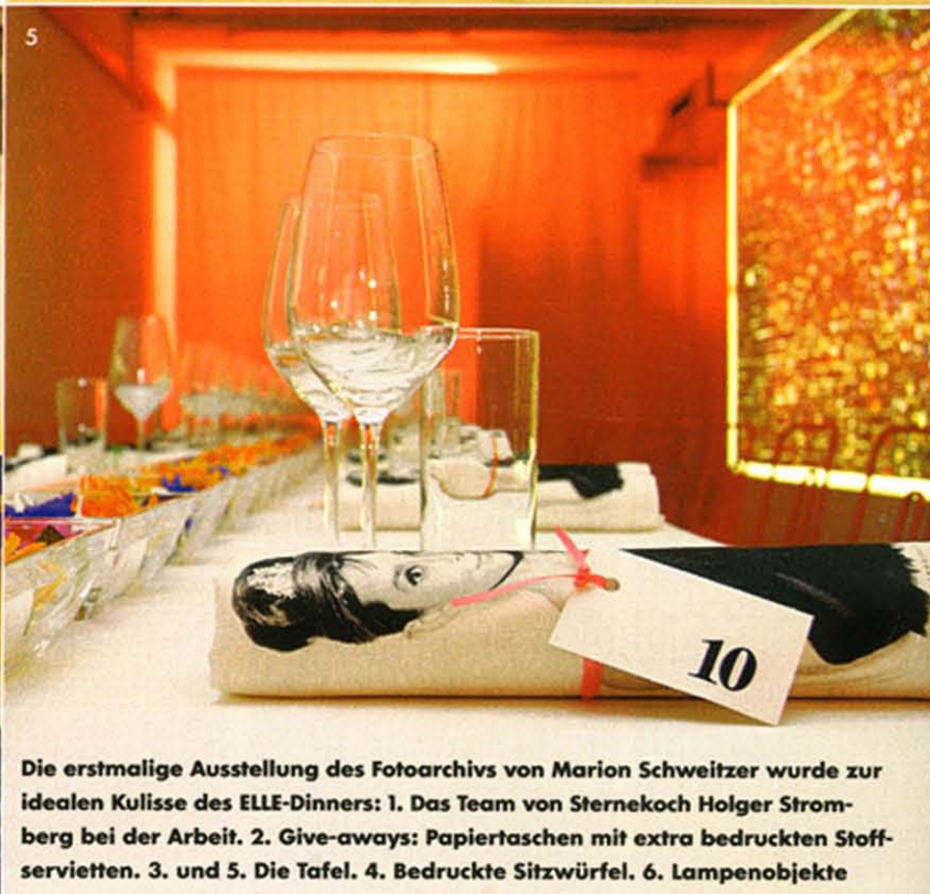
Die erstmalige Ausstellung des Fotoarchivs von Marion Schweitzer wurde zur idealen Kulisse des ELLE-Dinners: 1. Das Team von Sternekoch Holger Stromberg bei der Arbeit. 2. Give-aways: Papiertaschen mit extra bedruckten Stoffservietten. 3. und 5. Die Tafel. 4. Bedruckte Sitzwürfel. 6. Lampenobjekte