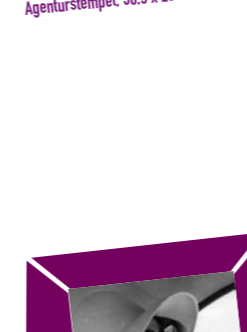
57 YOUSUF KARSH – ERNEST HEMINGWAY um 1960, Abzug um 1970, Verso Papieretikett mit Bildtext sowie Agenturstempel, 30,5 x 23 cm, € 2000