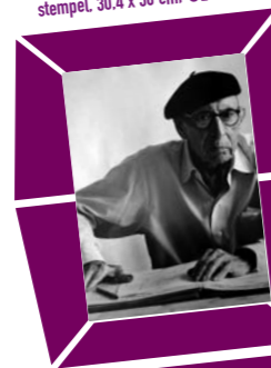
44 LORD SNOWDON (ANTHONY ARMSTRONG JONES) – PORTRÄT IGOR STRAWINSKY ZUM 88. GEBURTSTAG Vintage print 1970, Verso Papier- etikett mit Bildtext und Agentur- stempel, 30,4 x 38 cm, € 2000