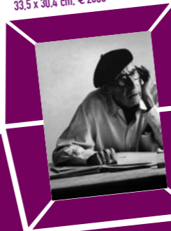
46 LORD SNOWDON (ANTHONY ARMSTRONG JONES) – PORTRÄT IGOR STRAWINSKY ZUM 88. GEBURTSTAG Vintage print 1970, Verso Papier- etikett mit Bildtext und Agenturstempel 33,5 x 30,4 cm, € 2000