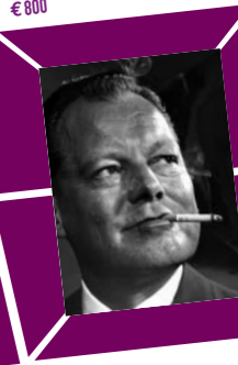
53 YOUSUF KARSH – WILLY BRANDT um 1966, Vintage print Verso Papieretikett mit Bildtext sowie Agentur- stempel, 20,6 x 15,3 cm, € 800