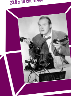
67 ANONYMER FOTOGRAF – DER KOMMUNIKATOR, USA, 1930er Jahre, Vintage print, 23,8 x 18 cm, € 400