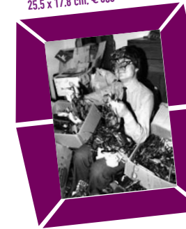
42 NILS JÖRGENSEN – DER BRILLENFREUND Vintage print, um 1977, Verso Agenturstempel mit Urheberangabe 25,5 x 17,8 cm, € 600