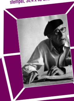
45 LORD SNOWDON (ANTHONY ARMSTRONG JONES) – PORTRÄT IGOR STRAWINSKY ZUM 88. GEBURTSTAG Vintage print 1970, Verso Papier- etikett mit Bildtext und Agentur- stempel, 30,4 x 38 cm, € 2000