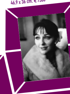
64 CHRISTIAN SKREIN – CHRISTINE KAUFMANN, Wien 1965 Vintage print, Am Terrand signiert und datiert, Verso Urheberstempel mit eigenhändiger Bezeichnung 46,9 x 36 cm, € 7500