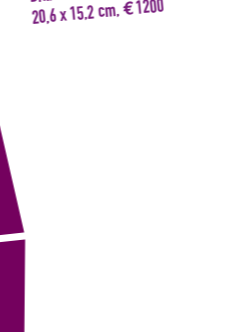
59 CECIL BEATON – PORTRÄT COCO CHANEL um 1967 Vintage print, Verso Papieretikett mit Bildtext sowie Agenturstempel 20,6 x 15,2 cm, € 1200