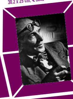
51 YOUSUF KARSH – LE CORBUSIER 1950er Jahre, Abzug um 1970, Verso Papieretikett mit Bildtext sowie Agenturstempel 30,2 x 25 cm, € 3000