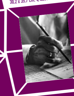
47 LORD SNOWDON (ANTHONY ARMSTRONG JONES) – DIE HÄNDE VON IGOR STRAWINSKY Vintage print 1970, Verso Papieretikett mit Bildtext und und Agenturstempel 30,2 x 35,7 cm, € 2000