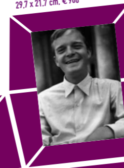
48 ANONYMER FOTOGRAF – TRUMAN CAPOTE, Venedig 1948 Vintage print, Verso Papieretikett mit Bildtext sowie Agenturstempel 29,7 x 21,7 cm, € 900