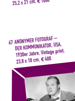
67 ANONYMER FOTOGRAF – DER KOMMUNIKATOR, USA, 1930er Jahre, Vintage print, 23,8 x 18 cm, € 400