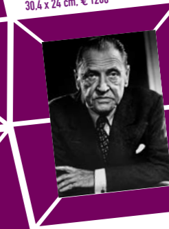
52 YOUSUF KARSH – DER SCHRIFTSTELLER Somerset Maugham, 1950er Jahre Abzug um 1970, Verso Papieretikett mit Bildtext sowie Agenturstempel 30,4 x 24 cm, € 1200